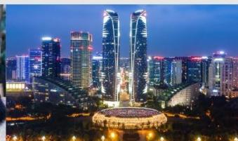
ตึกแฝดเจียงตู

*ทางบริษัทฯ ขอสงวนสิทธิ์ในการสลับโปรแกรมทัวร์ตามความเหมาะสมขึ้นอยู่กับสถานการณ์หน้างาน โดยคำนึงถึงผลประโยชน์ของลูกค้าเป็นสำคัญ