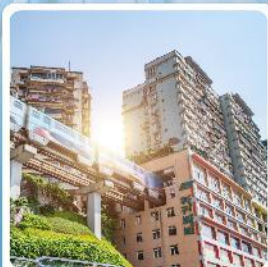
รถไฟฟ้าชุลติ๊ก

ไฮไลท์! เที่ยวอุทยานแห่งชาติหลุมบ่อฟ้า มรดกโลกระดับ 5A ชมรถไฟฟ้าทะลุตึก อลังการแสงสีที่หงหยาดัง