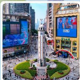
ถนนเจี๋ยฟางเป่ย์