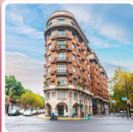
ถนนอู๋คัง