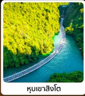
คุบเขาสิ่งโต

โอสลท! บินตรงลงเอินซือ เกี่ยวเอินซือเน่นจาดตีมทัวเมือง คุบเขาสิ่งโต ผังชานแกรนด์แคนยอน อุกยานจันลู่ชาน