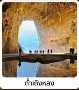
ถ้ำถึงหลวง