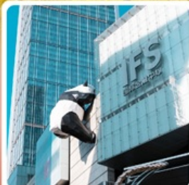
แพนด้ายักษ์ป็นตึก IFS