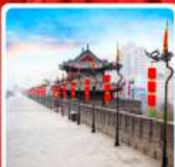
กำแพงเมืองโบราณซีอาน