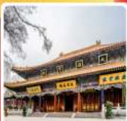
วัดต้าซิงซาน