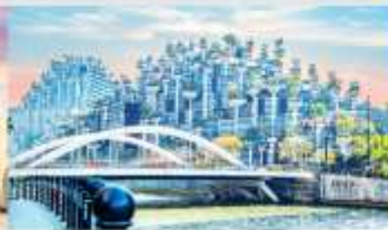
อาคารฟันทันไม้