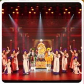
The Heritage Show