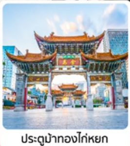
ประตูน้ำกองทัพหยก