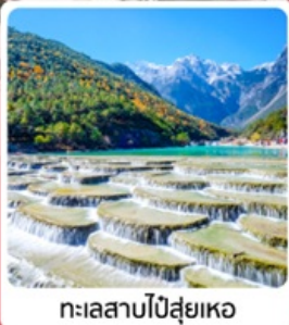
ทะเลสาบไป๋ส่วยเหอ