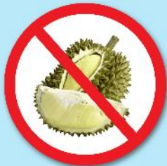
ผลไม้เขตร้อน ที่มีหนาม