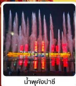
น้ำพุคังปาสือ