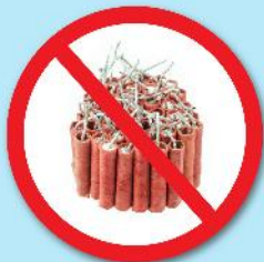
พลุ, ประทัด