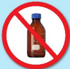
ขวดสารเคมี