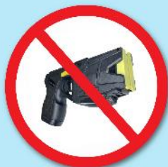
ปืนซ็อตไฟฟ้า