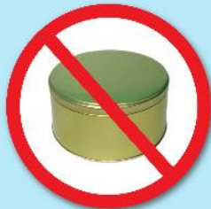
กล่องโลหะ