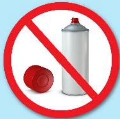
กระป๋องสเปรย์