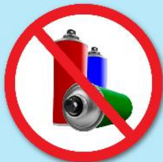
ขวดสเปรย์