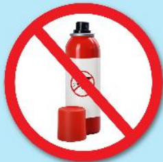
ขวดน้ำยา ฆ่าแมลง