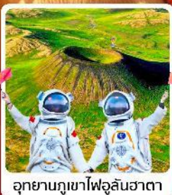
อุทยานภูเขาไฟอุลันฮาตา