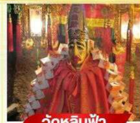
วัดหลิมฟ้า