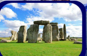
เข้าชมสโตนเฮนจ์