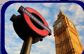
มหานครลอนดอน