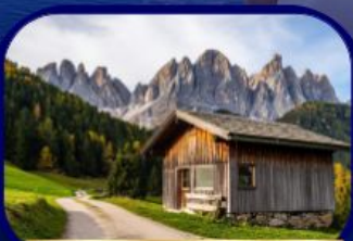
อุทยานฯ โดโลไมท์