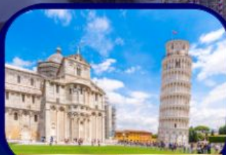
หอเอนแห่งเมืองปิซ่า