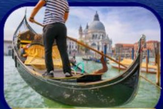
เที่ยวเกาะเวนิส