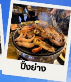
ปิ้งย่าง