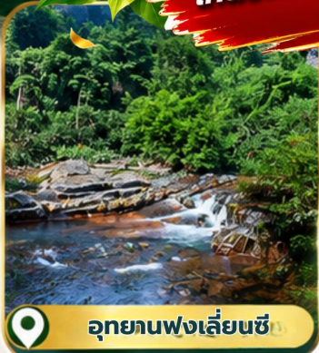
อุทยานฟงเลี่ยนซี