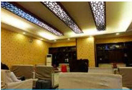
ศูนย์แพทย์แผนจีน

อัตราค่าบริการสำหรับโปรแกรมเสริมการแสดงชุด The love Story of Wooden man and Fairy Fox ท่านละ 400 หยวน (หรือประมาณ 2000.-บาทขึ้นอยู่กับอัตราแลกเปลี่ยน) ระยะเวลาที่ใช้ในการเที่ยวชมการแสดง ประมาณ 3 ชั่วโมง รวมเวลาเดินทางไปกลับค่าบริการรวม ค่าบัตรเข้าชม ค่ารถรับ ส่ง และค่าน้ำทิพย์ของไกด์ท้องถิ่น