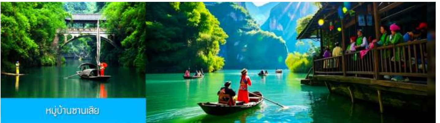
หมู่บ้านซานเสี