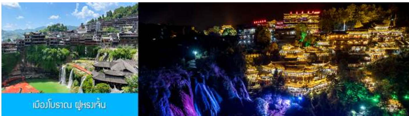
เมืองโบราณ ฟูหวางเจี้ยน

ขอเชิญสำหรับนักท่องเที่ยว.....นำท่านเดินชมจุดที่น่าสนใจต่าง ๆ ของเมืองโบราณฟูหวางเจี้ยน อาทิ สะพานคู่ หวางเจียว 土王桥 จุดชมวิวน้ำตกท้ายหมู่บ้าน 瀑布观景台 ทางเดินรอดน้ำตก 瀑布走道 (ท่านที่ต้องการไป เดินบริเวณทางเดินรอดน้ำตก ควรมีความพร้อมที่จะต้องเดินขึ้น ลงบันได้หลายสิบขั้น) ท่านสามารถชมการ แสดงพื้นเมือง ณ ลานกิจกรรมบริเวณทางเข้าหมู่บ้าน.... (ค่าทัวร์รวมค่ารถกอล์ฟรับ ส่งจากลานจอดรถไปยัง ทางเข้าอุทยาน)