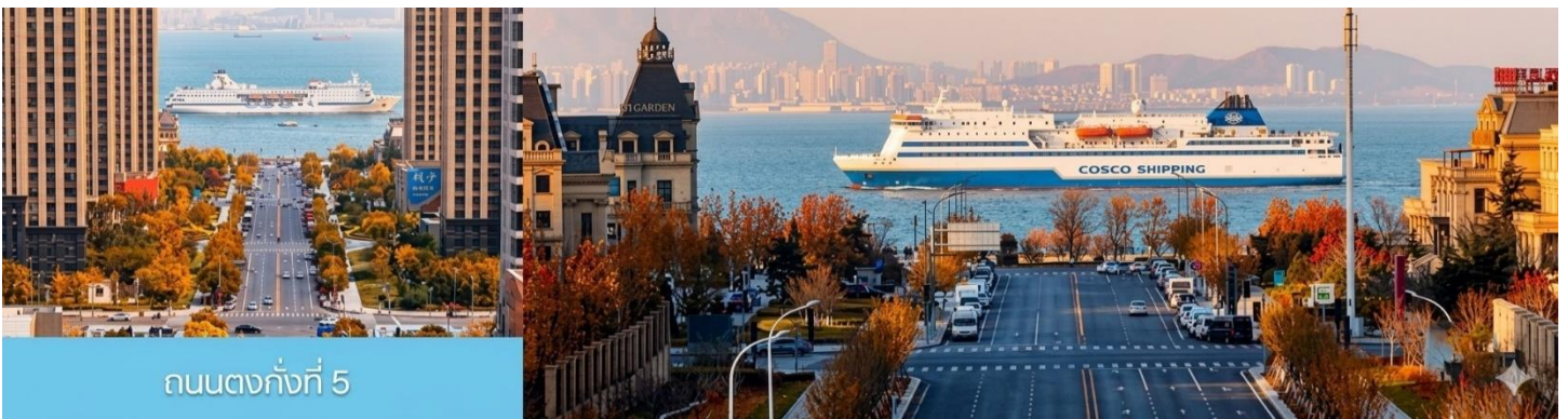
ถนนตงกั้งที่ 5

จากนั้นนำท่านเที่ยวชม สวนน้ำเมืองเวนิสตะวันออก 大连东方威尼斯城 เป็นเมืองเวนิสจำลองที่ถูกสร้างขึ้นด้วยทุนกว่า 8,000 ล้านบาท ออกแบบโดยบริษัท ARC จากประเทศฝรั่งเศส โดยจำลองผังเมืองเวนิสในประเทศอิตาลี บนพื้นที่กว่า 400,000 ตารางเมตร ประกอบด้วยคลองเวนิสและอาคารที่มีสถาปัตยกรรมแบบตะวันตกกว่า 200 หลัง มีบริการล่องเรือคอนโดล่าแก่นักท่องเที่ยว นำท่านเดินชม ถ่ายภาพที่ระลึกท่ามกลางอาคารสไตล์ยุโรป ตามอัธยาศัย.