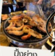
ปิ้งย่าง