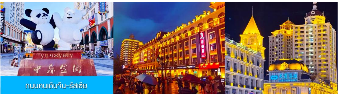
ถนนคนเดินจีน-รัสเซีย

ท่านสามารถเดินเที่ยวชม บริเวณจัตุรัสฯ เก็บภาพสวยงามของสถาปัตยกรรมสวยเก๋แบบรัสเซีย เที่ยวชมบริเวณล็อบบี้ของโรงแรมตุ๊กตารัสเซีย ที่มีการตกแต่งภายในอย่างวิจิตร งดงามทั้งลวดลายการตกแต่งและภาพสีน้ำมัน