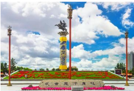
จัตุรัสเวงกิสข่าน

หลังอาหารนำท่านเดินทางสู่เมือง ไห่ลาเอ่อ 海拉尔市 (ระยะทาง 456 กม. ใช้เวลาเดินทางราว 5 ชั่วโมงครึ่ง)