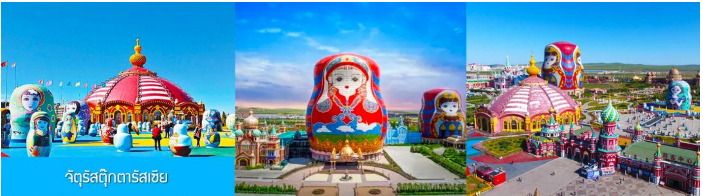
จัตุรัสตุ๊กตารัสเซีย