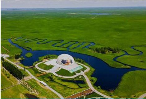
อุทยานชุ่มชื้นจาหลง

รับประทานอาหารเช้า ณ ห้องอาหารของโรงแรม (7)