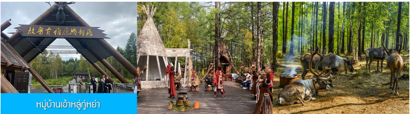
หมู่บ้านเอ้อเอ่อกู่ฮา