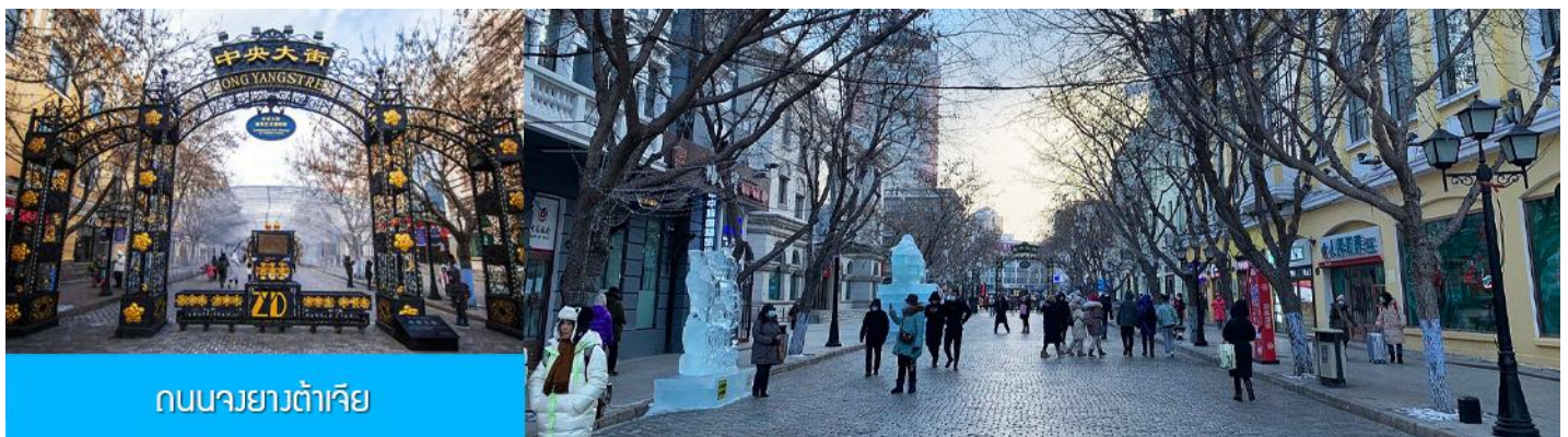
ถนนจงยางต้าเจีย