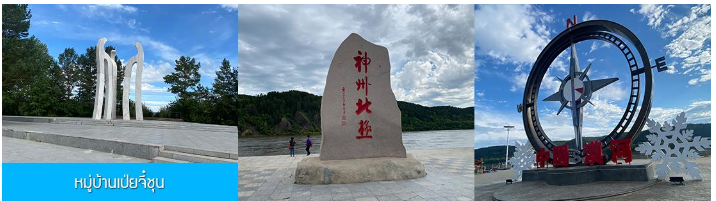
หมู่บ้านเป่ย์จื๋อ

เที่ยง รับประทานอาหารกลางวัน ณ ร้านอาหารระหว่างทาง (20)