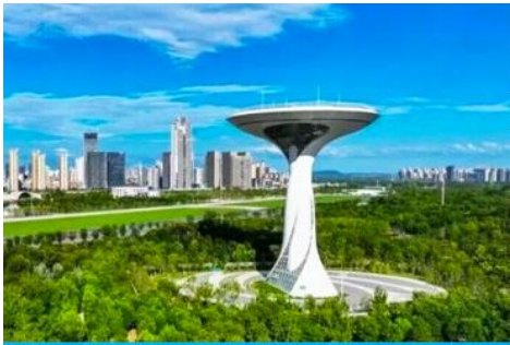
สวนสาธารณะลั่วกั๋ว

เช้า รับประทานอาหารเช้า ณ ห้องอาหารของโรงแรม (8)