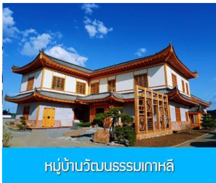
หมู่บ้านวัฒนธรรมเกาหลี

จากนั้นนำท่านเดินทางสู่เมืองตุนฮว่า 敦化 (ระยะทาง 130 กม. ใช้เวลาเดินทางราว 2 ชั่วโมง)