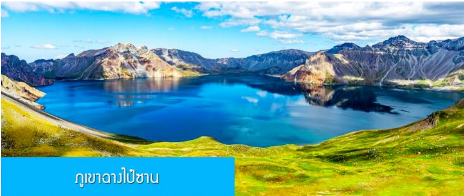
ภูเขาฉางไป่ซาน

วันที่สาม ภูเขาฉางไป่ซาน – ทะเลสาบเทียนจื่อ-น้ำตกฉางไป่ซาน-สระน้ำมรกต-หมู่บ้านวัฒนธรรมเกาหลี เช้า รับประทานอาหารเช้า ณ ห้องอาหารของโรงแรม (4)