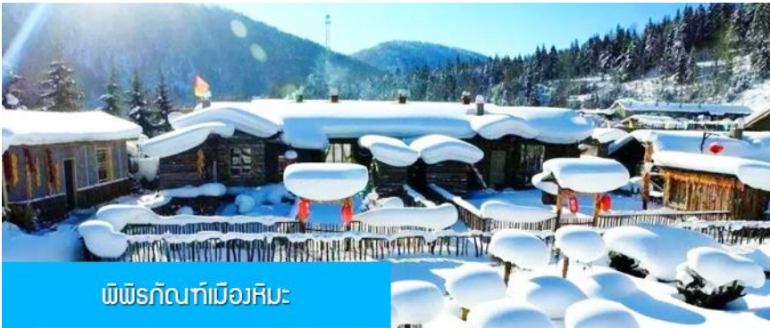
พืชรักกันที่เมืองหิมะ

และเครื่องใช้จำเป็นสำหรับการพักผ่อน ณ โฮมสเตย์ในเมืองหิมะในคืนนี้ เพื่อสะดวกต่อการเคลื่อนย้ายกระเป๋า ภายในโฮมสเตย์จะมีสบู์เหลว แชมพูภายในห้องน้ำ แปรงสีฟันยาสีฟัน แต่จะไม่มีหมวกคลุมผมสำหรับสุภาพสตรี ควรเตรียมไปด้วย