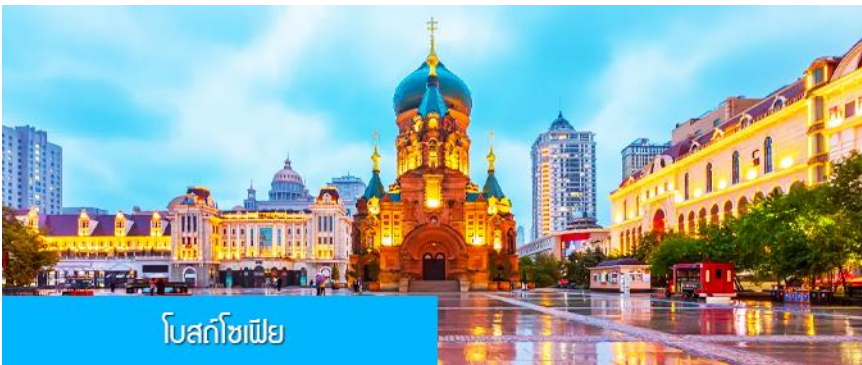
โบสถ์โซเฟีย