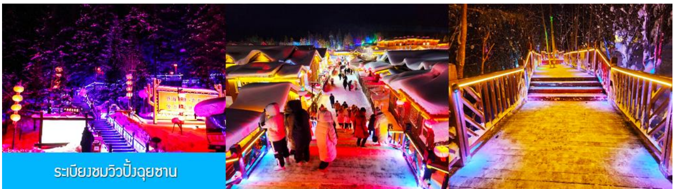
ระเบียบชมวิวยิ่งดูซาน

เมื่อเดินทางถึงหมู่บ้านหิมะ นำท่านเปลี่ยนมาใช้รถบัสของอุทยานเดินทางเข้าหมู่บ้าน เนื่องจากรถบัสส่วนตัวจะไม่สามารถเข้าไปในหมู่บ้านได้ นำท่านเช็คอินเข้าที่พักเรียบร้อยแล้ว