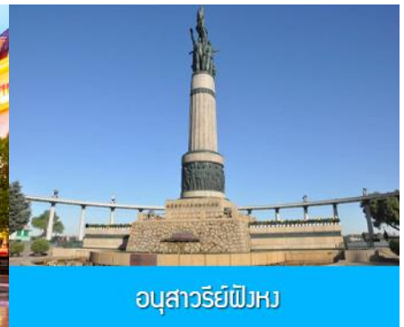
อนุสาวรีย์ผึ้ง