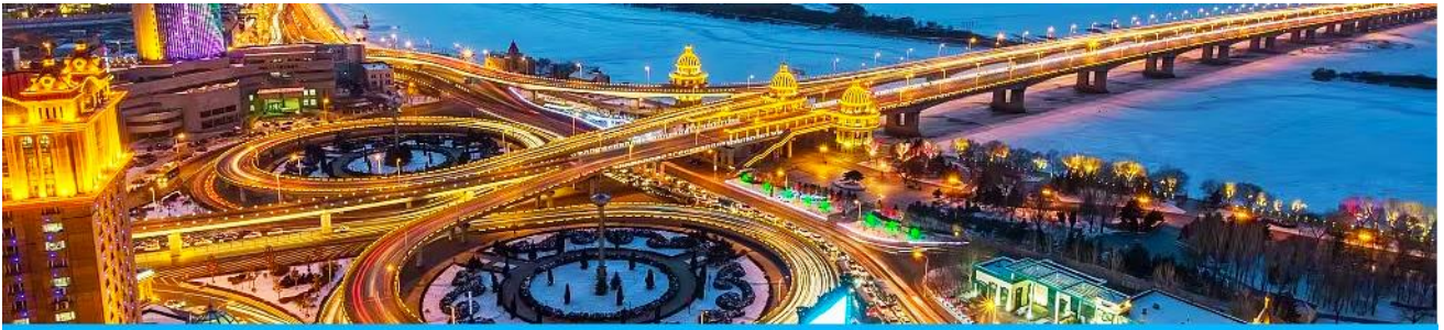
นครฮาร์บิน