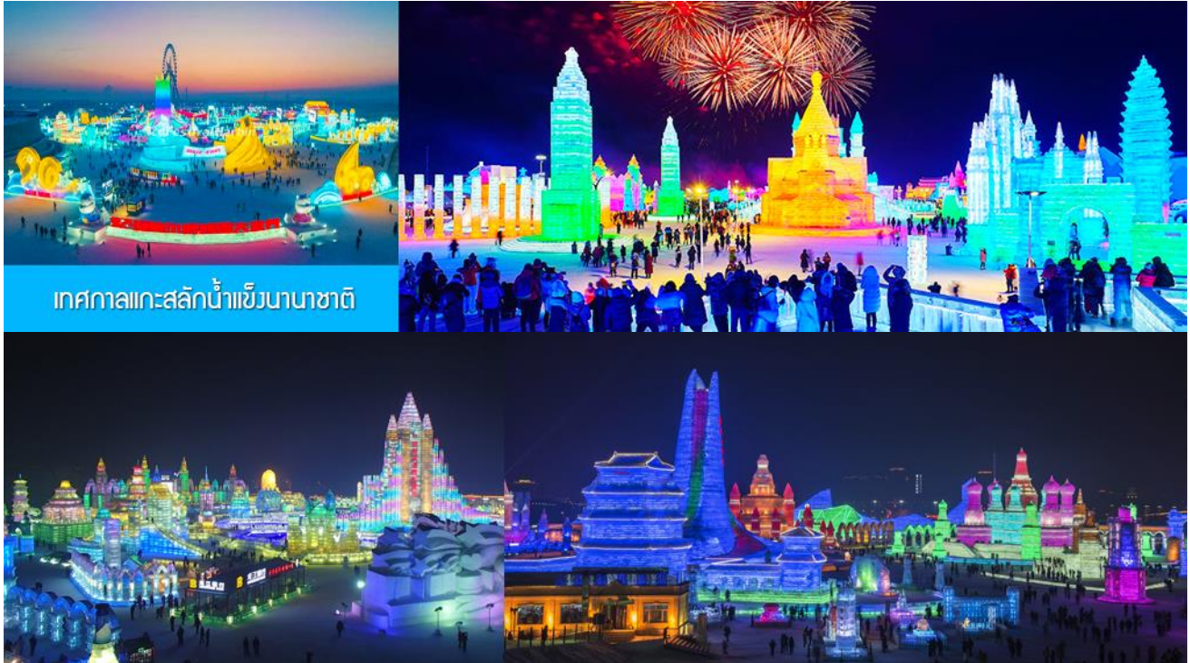
เทศกาลแกะสลักน้ำแข็งนานาชาติ

รับประทานอาหารค่ำ ณ ภัตตาคาร *ตุ๊กกี้* (14)