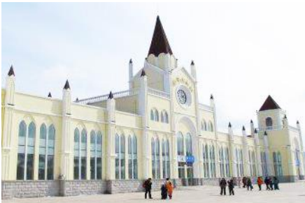
สถานีรถไฟยาบูลี

หมายเหตุ เพื่อความสะดวกในการเข้าพักใน HOME STAY ภายในหมู่บ้านหิมะ ทางทัวร์แนะนำให้ท่านจัดเตรียมเสื้อผ้าและเครื่องใช้เท่าที่จำเป็น 1 ชุดใส่กระเป๋าใบเล็กหรือเป้แบบสะพายได้ เพื่อสะดวกในการนำติดตัวไปใช้สำหรับคืนที่นอนในหมู่บ้านหิมะ หากนำกระเป๋าเดินทางใบใหญ่เข้าสู่ที่พักในหมู่บ้านอาจสร้างความไม่สะดวกแก่ท่าน จึงไม่แนะนำ