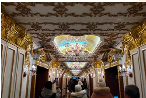
ตึกเภสัชกรรมฮาร์บิน

จากนั้นนำท่านเที่ยวชม ถนนมายังฤดู 中央大街 ถนนสายหลักของเมืองฮาร์บิน ถนนที่เต็มไปด้วยอาคารบ้านเรือนที่เป็นสถาปัตยกรรมตะวันตกที่สร้างในช่วงคริสต์ศตวรรษที่ 18 – 19 ที่เมืองนี้ถูกปกครองโดยรัสเซีย อีกทั้งเป็นถนนคนเดินที่เป็นแหล่งรวมร้านค้าสินค้าแบรนด์เนมทั้งในและต่างประเทศ ร้านจำหน่ายของที่ระลึกและสินค้าพื้นเมือง ร้านอาหารพื้นเมืองต่าง ๆ มากมาย ให้ท่านมีเวลาอิสระเดินเที่ยวและช้อปปิ้ง หรือลิ้มรสอาหารพื้นเมืองตามอัธยาศัย.. **ให้ท่านลิ้มรสไอศกรีมชื่อดังเก่าแก่ของเมืองฮาร์บินท่านละ 1 ท่านฟรี