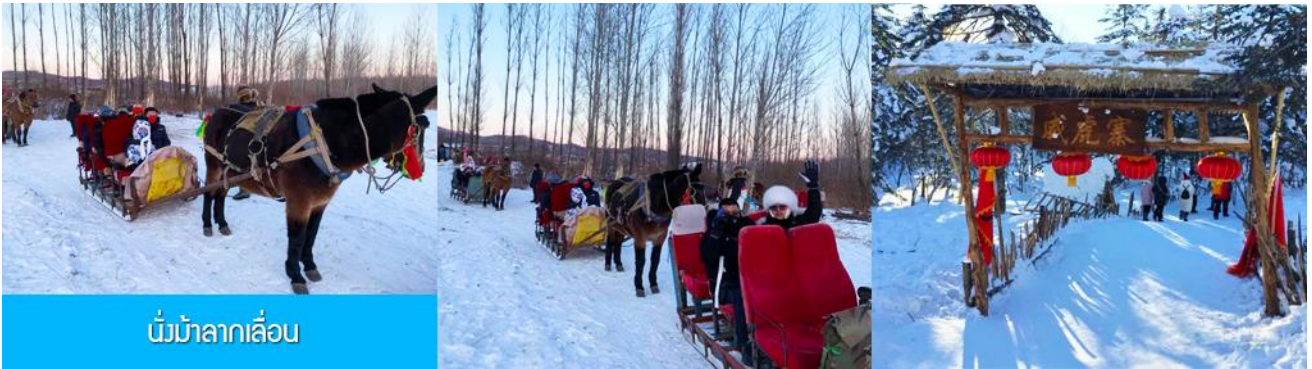
นั่งม้าลากเลื่อน