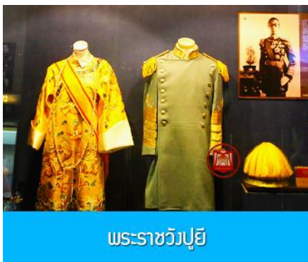
พระราชวังปู้ยี้

หลังอาหารนำท่านเช็คเอาท์ออกจากโรงแรมที่พักแล้วเดินทางสู่ เมืองฉางชุน 长春市 (ระยะทาง 120 กม.ใช้เวลาเดินทางราว 1 ชั่วโมงครึ่ง)