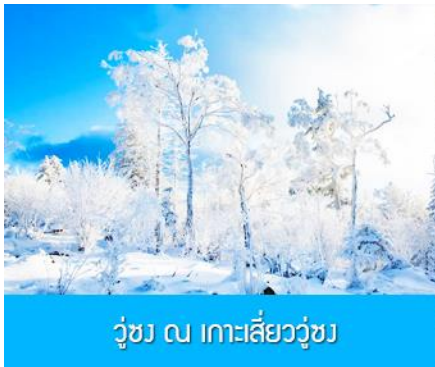
วู่ซง ณ เกาะลิ่ววู่ซง

พักที่ JILIN LUNWEIKE HOTEL โรงแรมระดับ 4 ดาวท้องถิ่นหรือเทียบเท่า ในเมืองจีหลิน