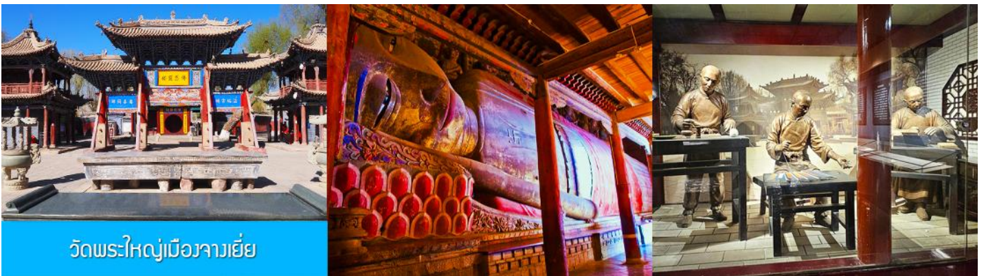
วัดพระใหญ่เมืองจางเยี่ย

รับประทานอาหารเช้า ณ ห้องอาหารของโรงแรม (15)