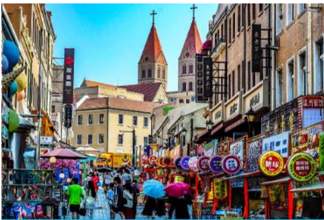
ถนนนางซาน

หลังอาหารนำท่านเดินทางชม สะพานจ้านเถียว 栈桥 เป็นแลนด์มาร์กแห่งประวัติศาสตร์คู่เมืองชิงเต่า สร้างเมื่อปี ค.ศ.1891 มีลักษณะเป็นสะพานหินทอดยาวกว่า 440 เมตรสู่ทะเล ปลายสะพานมีศาลา ทรงแปดเหลี่ยมสีแดงที่โดดเด่น ซึ่งเป็นสัญลักษณ์บนฉลากเบียร์ชิงเต่า ขึ้นชื่อเรื่องวิวสวย รับลมทะเล ให้ท่านเก็บภาพบรรยากาศ