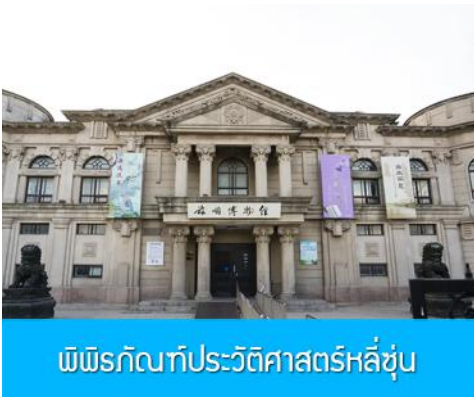
พิพิธภัณฑ์ประวัติศาสตร์หลี่ซุ่น

นำท่านเที่ยวชมและเก็บภาพ ณ สถานีรถไฟหลี่ซุ่น 旅顺火车站 เป็นสถานีปลายทางของเส้นทางรถไฟสาขา เส้นหยาง - ต้าเหลียน สร้างขึ้นในปีค.ศ. 1903 ออกแบบโดยสถาปนิกชาวรัสเซีย เป็นอาคารอิฐก่อปูนผสม โครงสร้างไม้ตามสถาปัตยกรรมรัสเซีย.