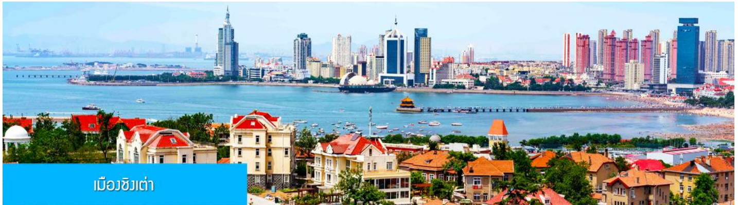
เมืองชิงเต่า