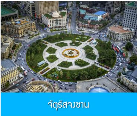
จัตุรัสวงเวียน