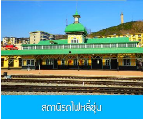
สถานีรถไฟหลี่ซุ่น

05.00 น. เรือท่องเที่ยวนำคณะเดินทางถึงท่าเรือเมืองต้าเหลียน นำท่านขึ้นรถบัสเพื่อเดินทางสู่ตัวเมืองต้าเหลียน เช้า รับประทานอาหารเช้า ณ ห้องอาหาร (7)