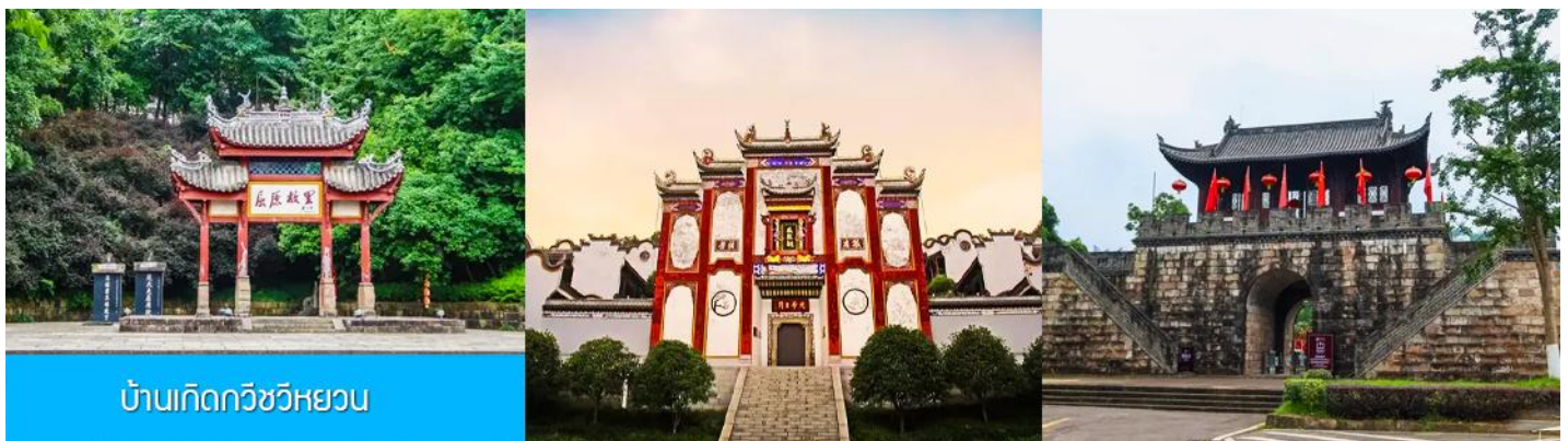
บ้านเกิดกวีชวีหยวน

พักที่ XIAZHOU HOTEL OR HONGQIAO HOTEL ระดับ 4 ดาวท้องถิ่นหรือเทียบเท่าในเมืองหยีซาง