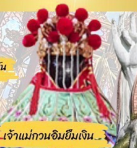
เจ้าแม่กวนอิมฮิมเงิน