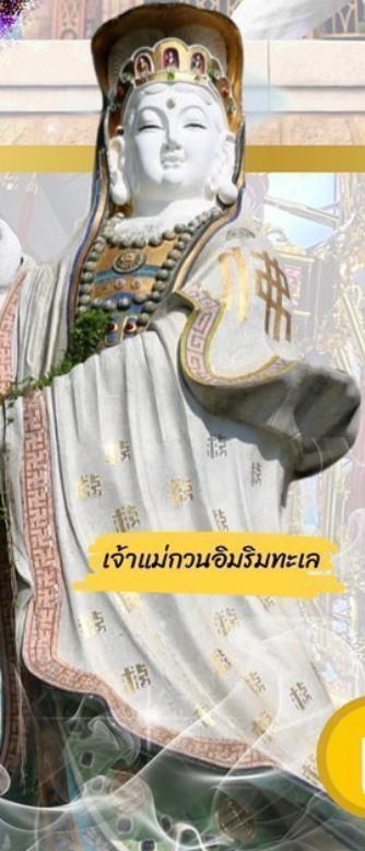
เจ้าแม่กวนอิมวิมทะเล