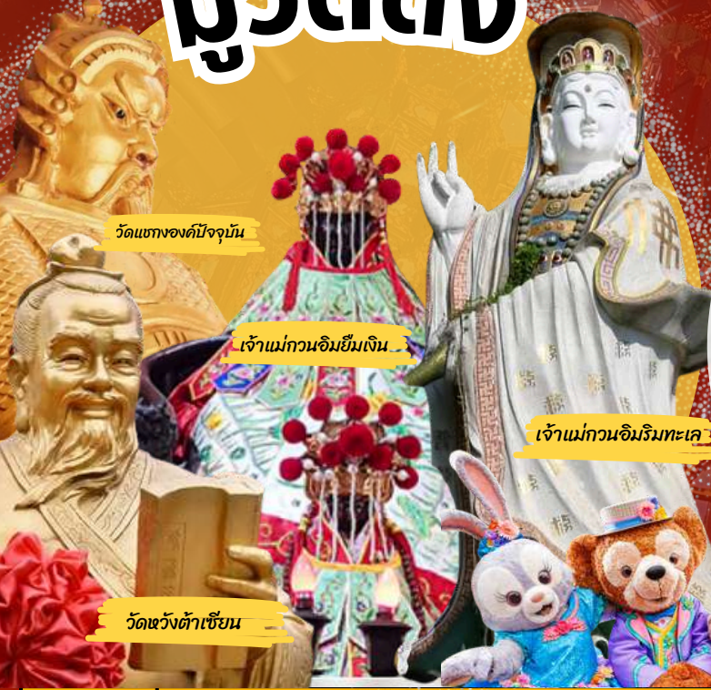
วัดแห่งองค์ปัจจุบัน