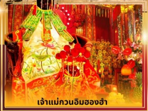
เจ้าแม่กวนอิมสองอ่า

ช้อปปิ้งบนคนเดินตงเหมิน เมืองโบราณหนานโกว วัดกวนอู ร้านหนังสือจงซูเก้อ ถ่ายรูปหน้าตึกฟิงอัน เจ้าแม่กวนอิมสองอ่า วัดหวังต้าเซียน วัดแชกงหมิว ช้อปปิ้งย่านจิมซาจู้ นองปิง 360 สักการะวัดพระใหญ่โป่หลิน ช้อปปิ้งซีตี้เกทเอาท์เล็ต