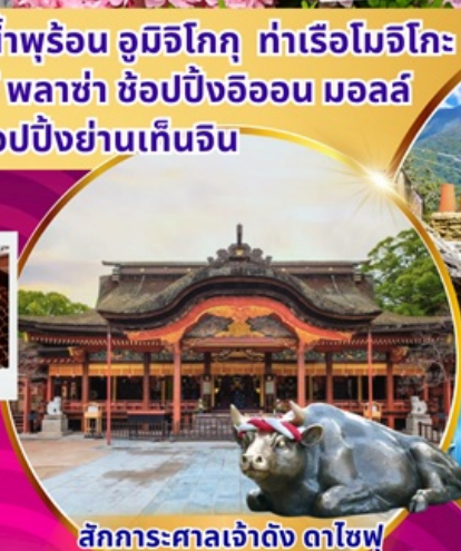
สักการะศาลเจ้าดัง ดาไซฟู