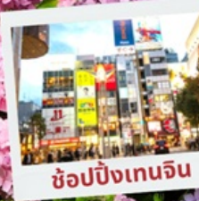
ช้อปปิ้งเทนจิน