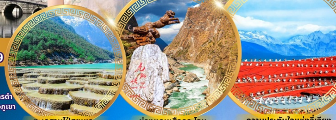
ทะเลสาบไป๋สือเหอ