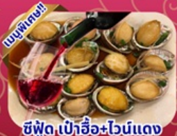
ซีฟู้ด เป้าอ้อ+ไวน์แดง