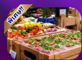
Buffet Dinner Banahill