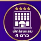
พักโรงแรม 4 ดาว