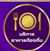
บริการอาหารท้องถิ่น