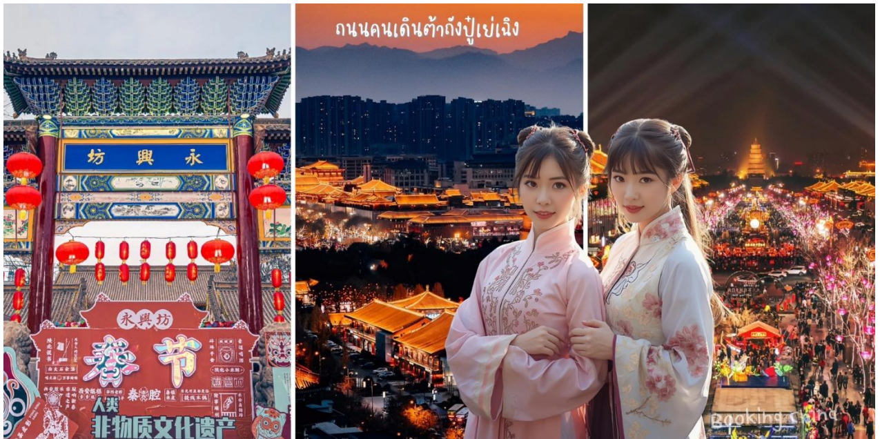
ถนนคนเดินต้าถั่งปู้เย่เจิง

จากนั้นนำท่านสู่ จากนั้นนำท่านสู่ ถนนคนเดินต้าถั่งปู้เย่เจิง (Datang Everbright City) หรือ ถนนวัฒนธรรมราชวงศ์ถัง ในเมืองซีอาน เป็นถนนวัฒนธรรมจำลองสมัยราชวงศ์ถังที่ใหญ่ที่สุดในจีน ตั้งอยู่ข้างเจดีย์ห่านป่าใหญ่ มีความยาวกว่า 2,100 เมตร โดดเด่นด้วยสถาปัตยกรรม แสงสีเสียง การแสดงวัฒนธรรม และรูปปั้นจำลองยุคถัง เป็นแลนด์มาร์คยอดฮิตที่จำลองความรุ่งเรืองของยุคทองมาไว้ในปัจจุบัน พิเศษ...แถมฟรี สวมใส่ชุดจีนโบราณ (ไม่รวมบริการแต่งหน้า+ทำผม) จากนั้นเดินทางสู่ เมืองซีอาน