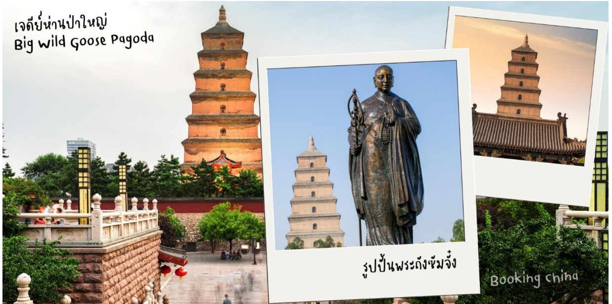
เจดีย์ห่านป่าใหญ่ Big Wild Goose Pagoda