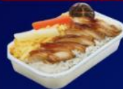
ข้าวหน้าไก่ย่างเทรียก

บริการอาหารร้อน และ น้ำดื่ม บนเครื่อง ขาไป และ ขากลับ