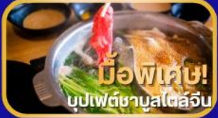
มือพิเศษ! บุปเป็ดชาบูสไตล์จีน