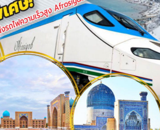
จัตุรัสเรจิสถาน