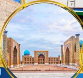
จัตุรัสเรจิสถาน