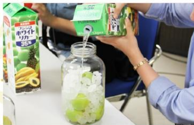
UMESHU MAKING AT NAKANO BC