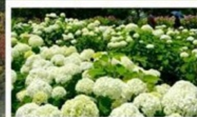
ชมดอกไม้ไฮเดรนเยีย