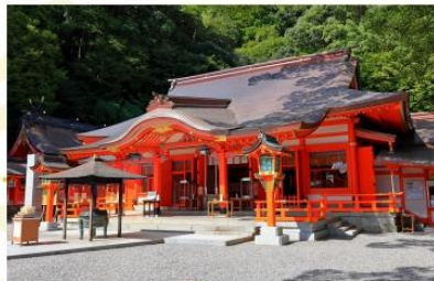
KUMANO NACHI GRAND SHRINE