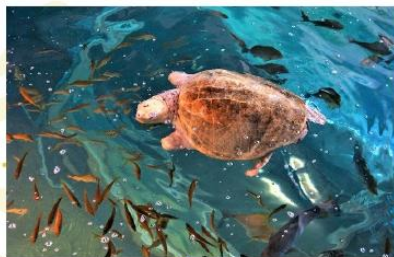
KUSHIMOTO MARINE PARK