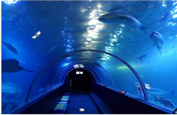
KUSHIMOTO MARINE PARK