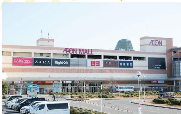
SHOPPING AT SENNAN AEON MALL