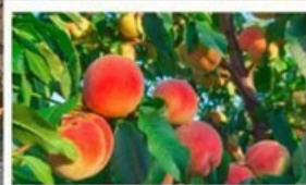
เก็บลูกพีชสด ๆ จากต้น