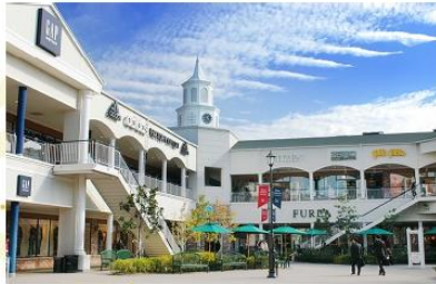
SHOPPING AT RINKU PREMIUM OUTLET