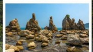
ชายหาดหินอาซึกุอิวะ

🧳 โหลด 23 KG. x2 ( รวม 46 KG. ) ทั้งไป - กลับ