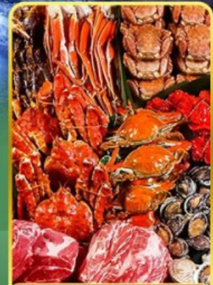
บึงย่างพรีเมี่ยมมันตะ