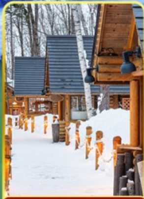
นิงเกิ้ลทอโร