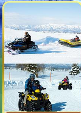
BIBAI SNOW LAND