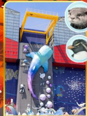
พิพิธภัณฑ์โคคุคัง