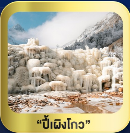
“ปี้เฉิงโกว”

นั่งกระเช้าชมวิว ภูเขาหิมะ-ต้ากู่กลาเซียร์ • ชมความสวยงาม ณ อุทยานปี้เฉิงโกว ห้องสมุดจงซูเก๋อ • ศูนย์หมีแพนด้า • ตงเจียวจี้อี้ • ซอยกว้างชวยແคບ