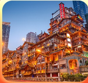
“ล่องเรือชมฉางชิ่งหงหยาดัง”