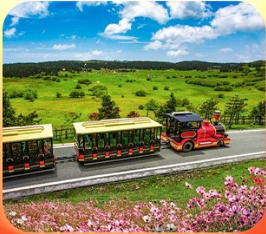
“อุทยานเขานางฟ้า”

บินตรงลงชิง • อุ๋หลง หลุมฟ้าสะพานสวรรค์ • ระเบียบแก้ว • อุทยานเขานางฟ้า หงหยาดัง • นั่งรถไฟทะลุติ๊ก • ล่องเรือชมฉางชิ่งยามค่ำคืน • ศาลาประชาคม (ด้านนอก) มรดกโลกผาหินแกะสลักต้าจู้ • เมืองโบราณสี่ปาตี • วัดหลิวฮั่น • ตึกตะเกียบ