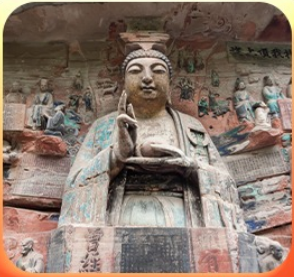
“ผาหินแกะสลักต้าจู้”