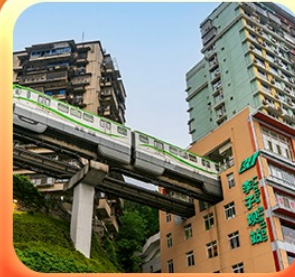
“นั่งรถไฟทะลุติ๊ก”