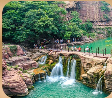
“อุทยานหยุ่นไท่ซาน”