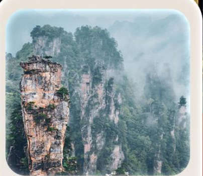
“หุบเขาอวตาร”