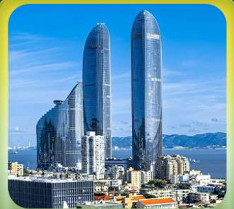
“ตึกแฝดเซี่ยะเหมิน”