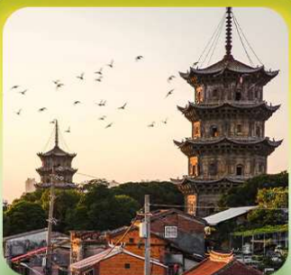
“เมืองโบราณฉวนโจ้ว”