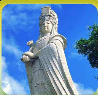
“เจ้าแม่กิมกิมหมาโจ้ว”

厦门航空 XIAMENAIR สายการบิน Xiamen Air (MF)