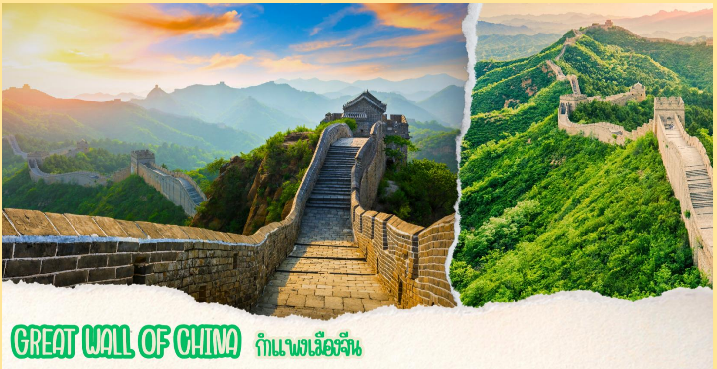
GREAT WALL OF CHINA กำแพงเมืองจีน

จากนั้นนำท่านชม กำแพงเมืองจีน ด่านฉีหยงกวน สร้างเมื่อกว่า 2,500 ปีมาแล้ว ซึ่งเป็น 1 ใน 7 สิ่งมหัศจรรย์ของโลก ยุคกลาง มีความยาวประมาณ 21,195 กิโลเมตร เป็นกำแพงที่มีป้อมคั่นเป็นช่วง ๆ ของจีนสมัยโบราณ กำแพงส่วนใหญ่ที่ปรากฏในปัจจุบันสร้างขึ้นในสมัยราชวงศ์ฉิน ทั้งนี้เพื่อป้องกันการบุกรุกจากชาวจีน โดยแบ่งเป็นหลายป้อมปราการโดยด่านฉีหยงกวน ขึ้นชื่อเรื่องความสวยงามของทิวทัศน์ภูเขาสลับไปมา กำแพงเมืองจีนได้ขึ้นทะเบียนเป็นแหล่งมรดกโลกเมื่อปี พ.ศ. 2530