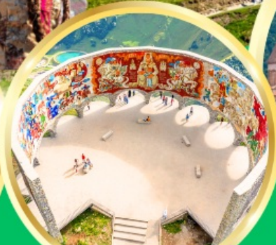
Russian-Georgian Friendship Monument