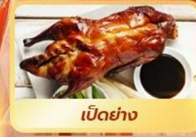
เป็ดย่าง