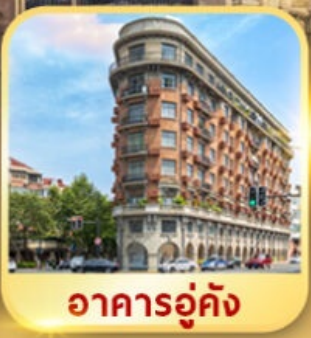
อาคารอู๋คัง