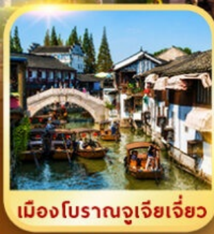
เมืองโบราณจูเจียเจี่ยว