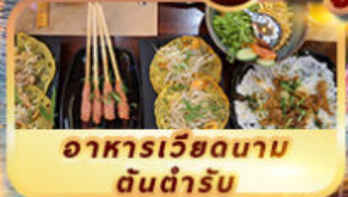
อาหารเวียดนาม ต้นตำรับ