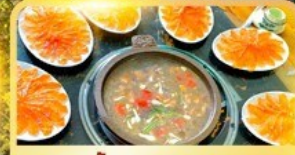
สุกี้ปลาแซลมอน