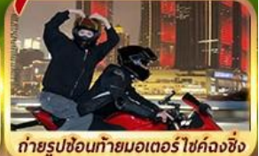
OPTION!! ถ่ายรูปขี่มอเตอร์ไซด์ลงซิ่ง