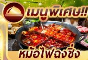
เมนูพิเศษ!! หม้อไฟลงซิ่ง