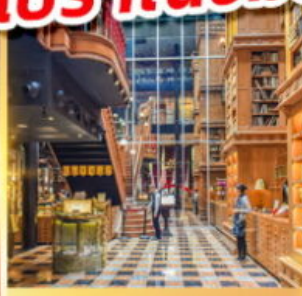
ร้านไอศกรีมมียาฮาร์