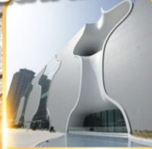
โรงละครไถจง