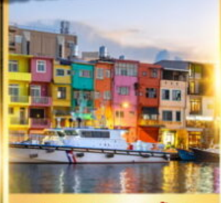
ท่าเรือประมงเจิ้งปิง